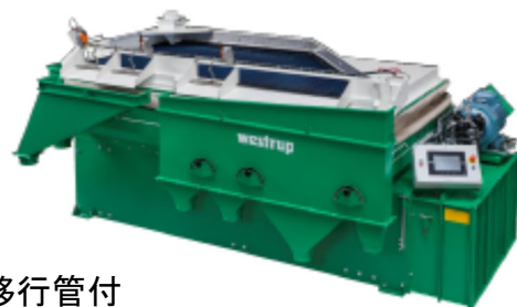
オプションの排出口移行管付