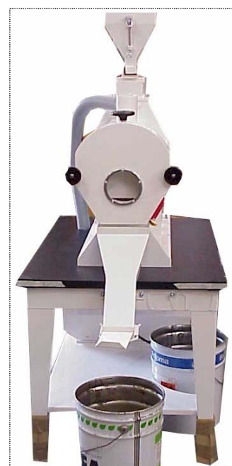
排出パイプ接続付 (オプション)