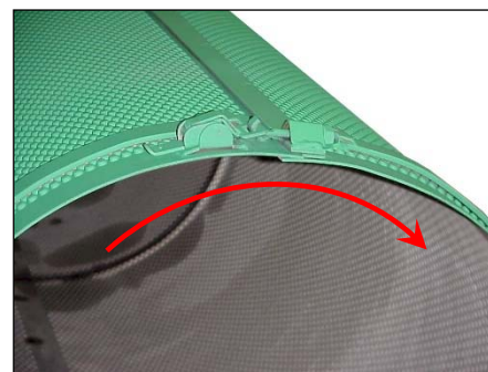
マントル接合部 (矢印は回転方向)